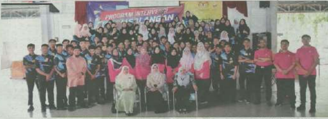
SEKELUAS 100 pelajar tingkatan lima bergambar bersama pada majlis penutup Program Interviu Katerangan Pelajar peringkat Majlis Agama Islam dan Adat Melayu Perak di Dewan Eksposit, Taiping, Perak baru-baru ini.