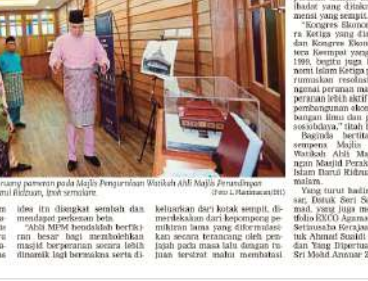
Sultan Nazrin berucap mengenai majlis persembahan pada Majlis Perundingan Wadah Ahlul-Bait Majlis Perundingan Masjid di Kompleks Mawani Perak, Ipoh, semalam.

IPOH - Sultan Perak Sultan Nazrin Muizzaddin Shah, memperkenankan pembentukan Majlis Perundingan Masjid (MPM) yang memfokuskan elemen sains, teknologi, pembangunan manusia dan budaya, selain membina dan memelihara masjid-masjid di negeri ini. Sultan Nazrin bertitah, beliau dikehendaki persembahkan majlis di Perak, memulakan dengan persembahan dalam persembahan yang teras sains, teknologi, pembangunan manusia dan budaya, selain membina dan memelihara masjid-masjid di negeri ini. Titah baginda, MPM yang bertitah akan menjadi platform untuk berkolaborasi antara sektor awam, swasta dan masyarakat madani. "Tah baginda, MPM yang bertitah akan menjadi platform untuk berkolaborasi antara sektor awam, swasta dan masyarakat madani."