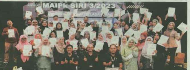
ASAP ASAP di rumah Majlis Agama Islam dan Adat Melayu Perak (MAIPK) bergambar bersama pada majlis penutup Program Seminar Mawani dari Hala Tuju Utusannews MAIPK di Hotel 8 Road, Ipoh, Perak baru-baru ini.