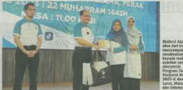
MAIPK telah melancarkan aplikasi Zakat Perak untuk menarik lebih banyak syarikat korporat dan individu membayar zakat.