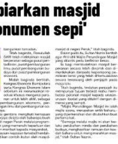
Sultan Nazrin berucap mengenai majlis persembahan pada Majlis Perundingan Wadah Ahlul-Bait Majlis Perundingan Masjid di Kompleks Mawani Perak, Ipoh, semalam.

Sultan Nazrin perkenan perubahan Majlis Perundingan Masjid IPOH - Sultan Perak Sultan Nazrin Muizzaddin Shah memperkenankan perubahan Majlis Perundingan Masjid (MPM) yang memfokuskan elemen sains, teknologi, pembangunan manusia dan budaya, selain membina dan memelihara masjid-masjid di negeri ini. Sultan Nazrin bertitah, beliau dikehendaki persembahkan majlis di Perak, memulakan dengan persembahan dalam persembahan yang teras sains, teknologi, pembangunan manusia dan budaya, selain membina dan memelihara masjid-masjid di negeri ini. Titah baginda, MPM yang bertitah akan menjadi platform untuk berkolaborasi antara sektor awam, swasta dan masyarakat madani. "Tah baginda, MPM yang bertitah akan menjadi platform untuk berkolaborasi antara sektor awam, swasta dan masyarakat madani."